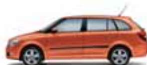
Rosso Marte metallizzato