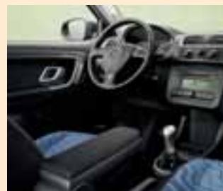
Interno Style blu (plancia strumenti Onyx-Onyx)