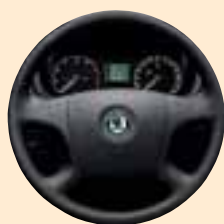
Volante a quattro razze

Climatizzatore Climatronic con regolazione elettronica e filtro combinato: mantenimento automatico della temperatura interna, regolazione automatica.