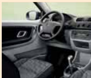
Interno Style grigio (plancia strumenti Onyx-Silver)