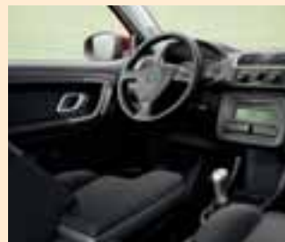
Interno Pulse - sedili sportivi