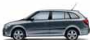
Grigio Fumo metallizzato