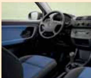
Interno Stone blu