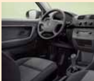
Interno Stone grigio