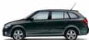
Nero Tulipano perlato