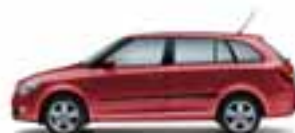
Rosso Rubino metallizzato