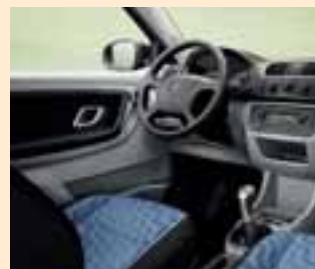
Interno Style blu (plancia strumenti Onyx-Silver)