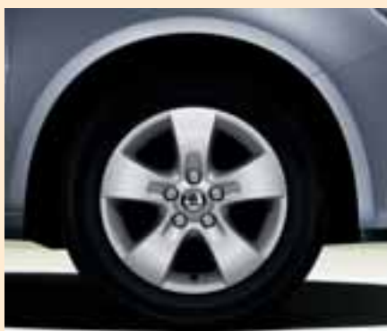
Cerchi Atik in lega 6.0J x 14" per pneumatici 185/60 R14.