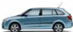
Grigio Titanio metallizzato