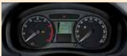
Quadro strumenti base