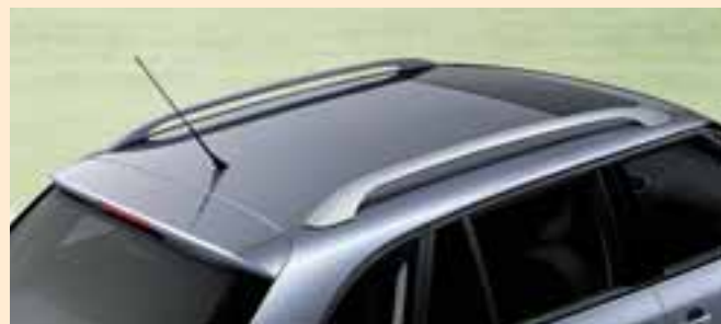
Mancorrenti al tetto in colore argento. A richiesta.