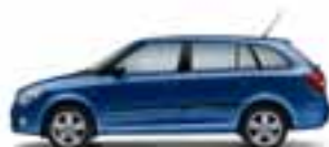
Blu Zaffiro metallizzato