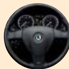
Volante sportivo a tre razze rivestito in pelle