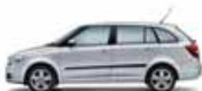
Argento Brillante metallizzato