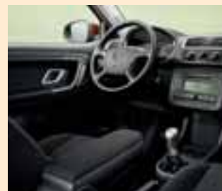
Interno Chic Night