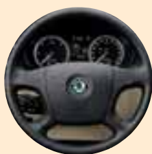
Volante a quattro razze rivestito in pelle