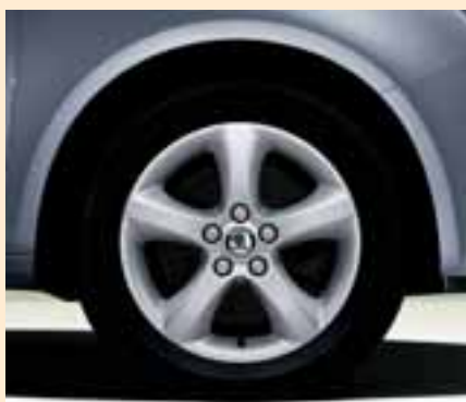
Cerchi Antares in lega 6.0J x 15" per pneumatici 195/55 R15.