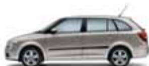
Beige Cappuccino metallizzato