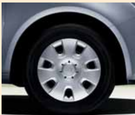
Cerchi Draco in acciaio 5.0J x 14" per pneumatici 165/70 R14.