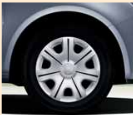
Cerchi Tethys in acciaio 6.0J x 14" per pneumatici 185/60 R14.