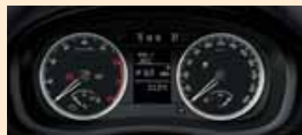
Quadro strumenti High-line con display MaxiDOT