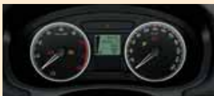
Quadro strumenti con computer di bordo