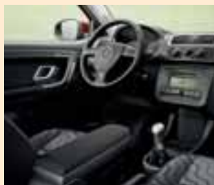
Interno Style grigio (plancia strumenti Onyx-Onyx)