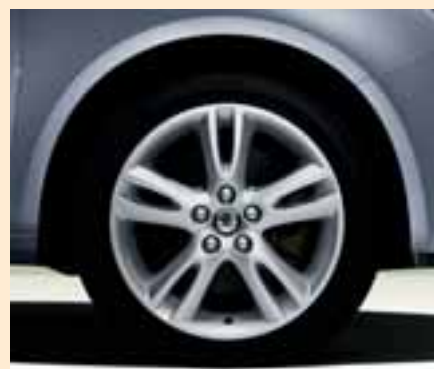
Cerchi Atria in lega 6.5J x 16" per pneumatici 205/45 R16.